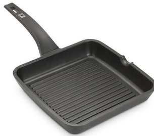
Sartén-parrilla Induction PRO 8212 000