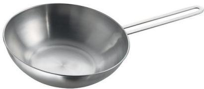
Sartén wok con un fondo plano Induction PRO 8211 000